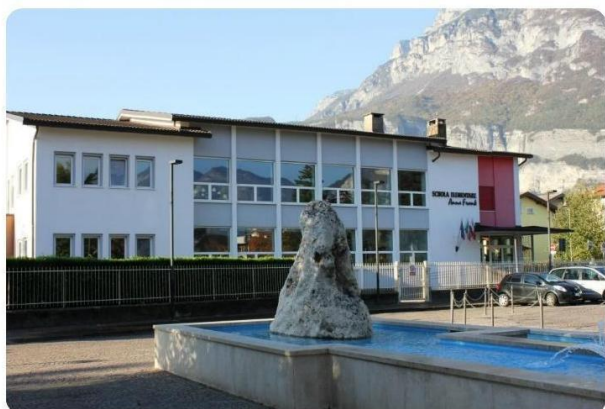
Scuola primaria "Anna Frank" - Zambana