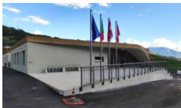
Scuola primaria "Don Milani" - Pressano