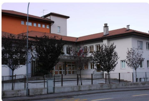
Scuola secondaria di primo grado "A. Stainer" - Lavis

Il Progetto d'Istituto è triennale e può essere rivisto annualmente.