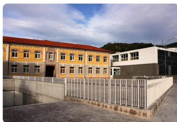
Scuola primaria "Don Grazioli" - Lavis